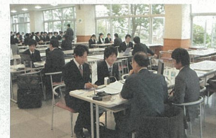
学内合同企業セミナー