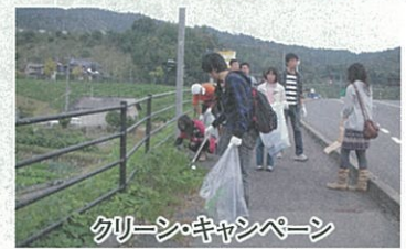
クリーン・キャンペーン