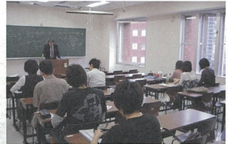
公務員試験対策サマーセミナー

また、1月には「学内合同企業セミナー」を開催し、採用計画が立てにくい状況にも関わらず、多くの企業に参加いただきました。このように学生と企業担当者が直接コミュニケーションを取る機会を通して、本学への理解は深まるものと考えています。