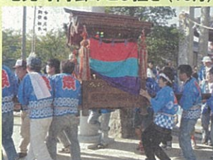
地元町内会みこし担ぎ(10月)