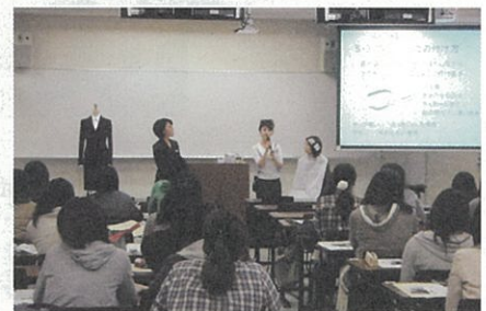
女子学生のためのリクルートセミナー