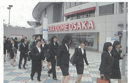
市大業界研究ツアー