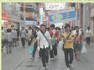
ごみゼロクリーンウォーク(6月)