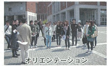
オリエンテーション